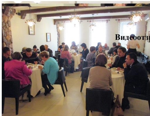
Видеозвезды участников семинара

Дополнительными «бонусами» для участников семинара служат дополнительная скидка при участии в последующих мероприятиях «АКАТО», а также право на дополнительные бесплатные консультации эксперта по любым вопросам (посредством электронной почты).