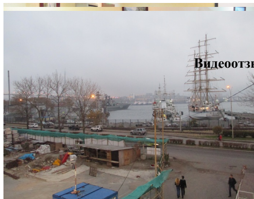
Видеоотзывы участников семинара

Дополнительными «бонусами» для участников семинара служат дополнительная скидка при участии в последующих мероприятиях «АКАТО», а также право на дополнительные бесплатные консультации эксперта по любым вопросам (посредством электронной почты).